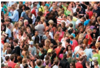
Figuur 4 Een groep mensen

Koppeling met de indicator van de loopbaancompetentie netwerken: Ik beschik over een netwerk van mensen die mij kunnen helpen bij mijn (studie)loopbaan.