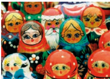
Figuur 3 Matrosjka's