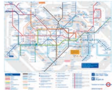
Figuur 2 Metrokaart van Londen

Trefwoorden: in kaart hebben, sturing, kennis over netwerken en netwerkvorming, typen relaties (uitwisseling), bewustzijn, kennissen, goede vrienden, ons-kent-ons. Koppeling met de indicator van de loopbaancompetentie netwerken: Ik beschik over een netwerk van mensen die mij kunnen helpen bij mijn (studie)loopbaan.